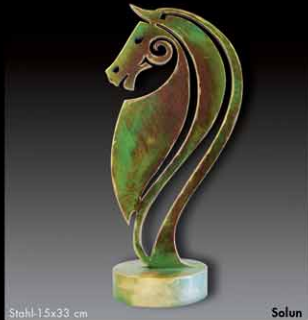
Stahl 15x33 cm