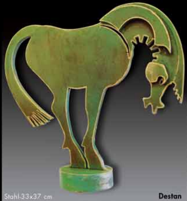
Stahl 33x37 cm