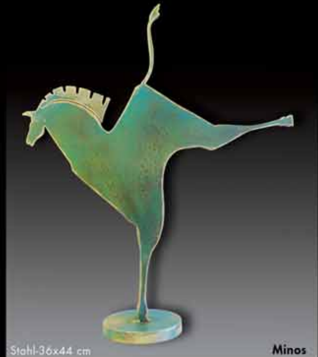
Stahl 36x44 cm