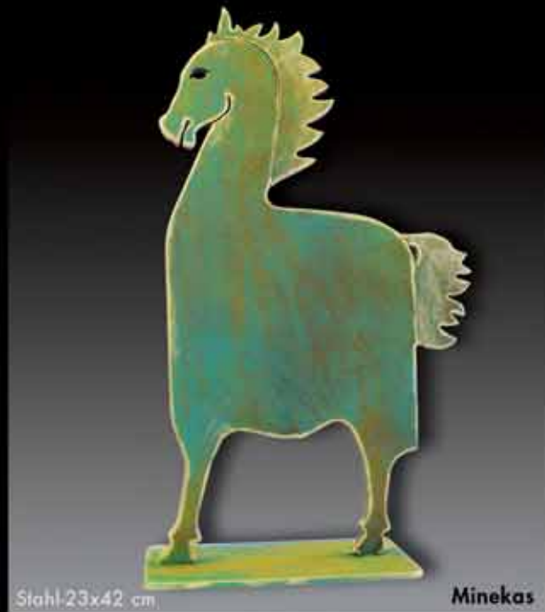
Stahl 23x42 cm