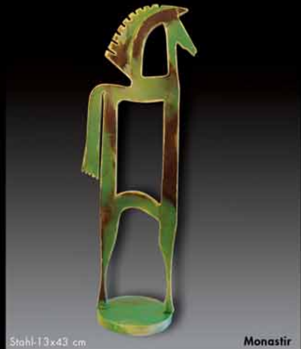
Stahl 13x43 cm