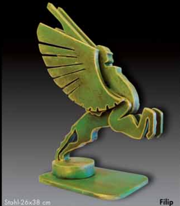
Stahl 26x38 cm