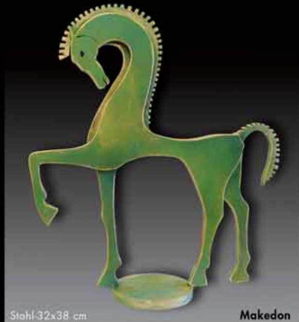
Stahl 32x38 cm