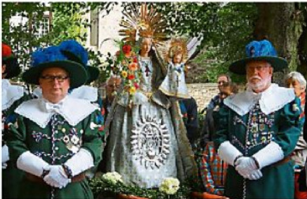
In den sicheren Händen der Hellebardiere bildet das Marienbild aus der Laurentiuskirche das Zentrum der großen Stadtprozession durch die Warendorfer Innenstadt. Stationen der Prozession waren die neun Marienbügen.

Mariä Himmelfahrt: Große Stadtprozession durch die Bügen