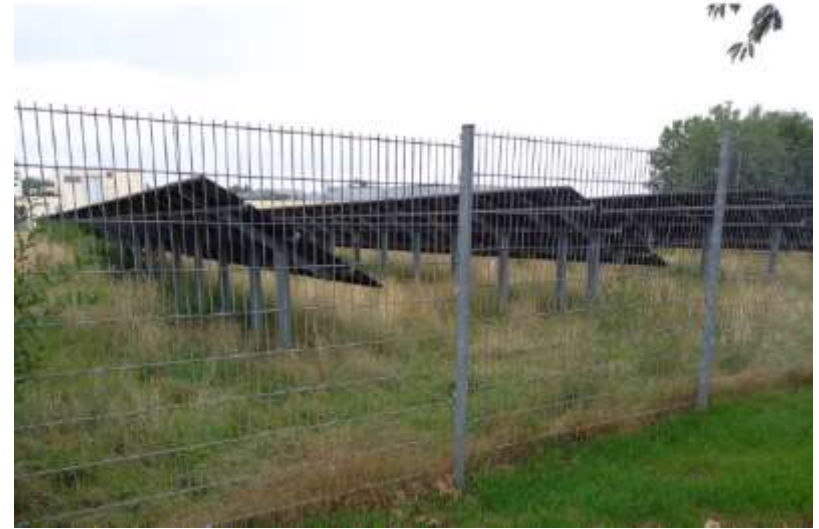
– Freiflächen-PV in Milte