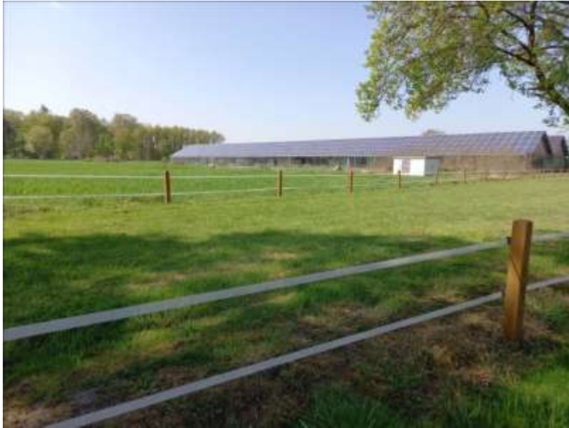
– Große PV-Dachanlage in Vohren