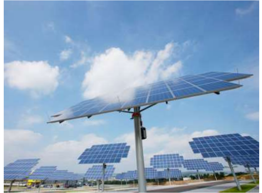
– Nachgeführte PV-Anlage