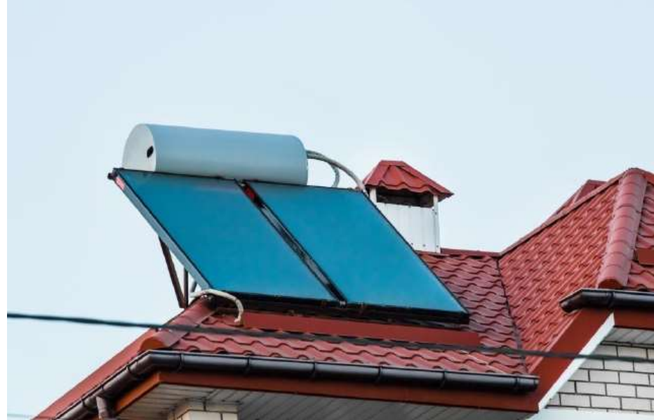
– Flachkollektor Kompaktanlage