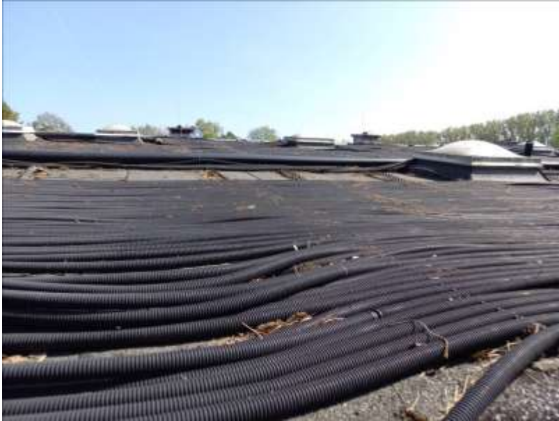
– Solarabsorber Freibad Warendorf