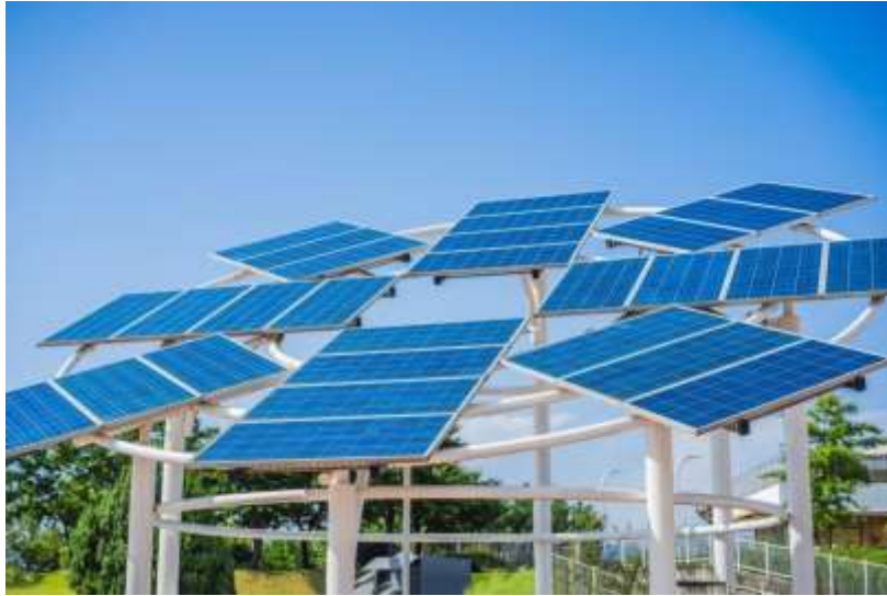
– Sonderanlage PV