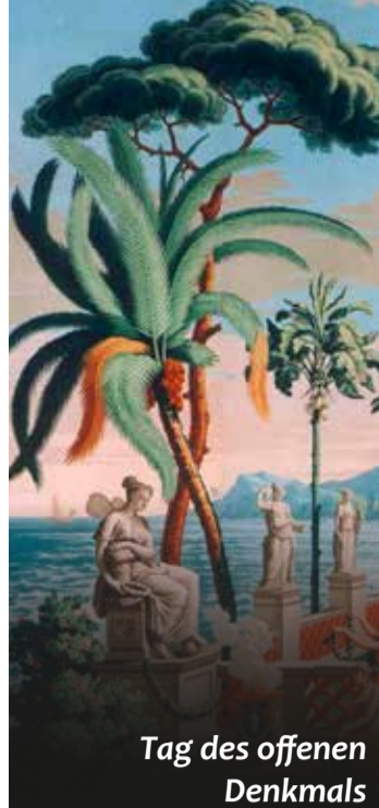
Tag des offenen Denkmals