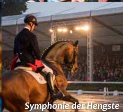
Symphonie der Hengste