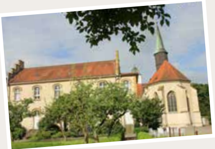
Kloster Vinnenberg, Milte

Stadt Warendorf Tourist-Information Emsstraße 4 48231 Warendorf T 0 25 81 – 54 54 54 F 0 25 81 – 54 54 11 tourismus@warendorf.de warendorf.de | warendorf-erleben.de