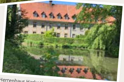
Herrenhaus Harkotten, Füchtorf