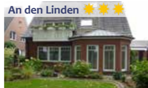
An den Linden ☀☀☀