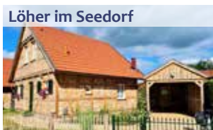
Löher im Seedorf