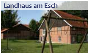
Landhaus am Esch