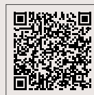
AGB für Tagesprogramme und touristische Einzelleistungen