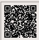
Datenschutzinformation für unsere Gäste

Bitte lesen Sie die Reisebedingungen aufmerksam durch, sie sind Bestandteil eines jeden Reisevertrages mit der Tourist-Information der Stadt Warendorf.