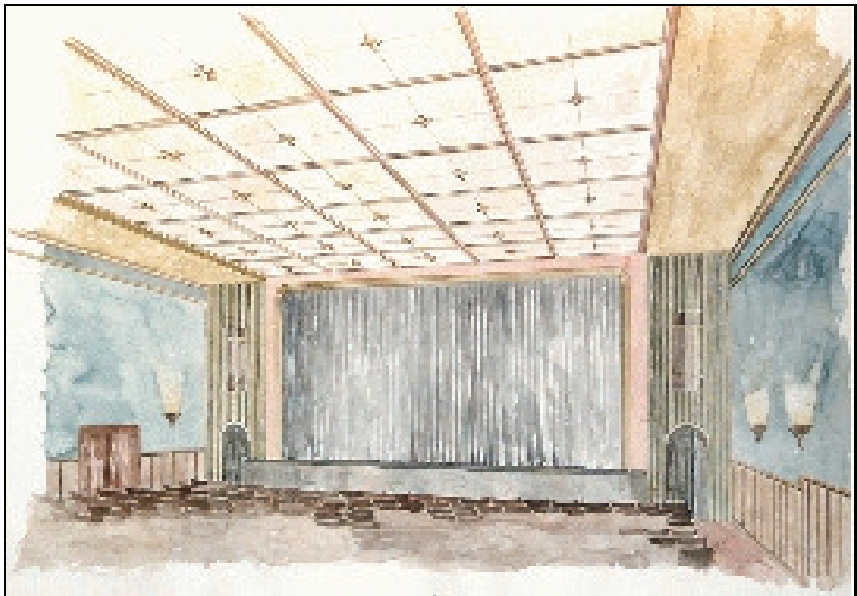
Gerald Konert Aquarell Paul-Schallück-Saal (Theater am Wall)