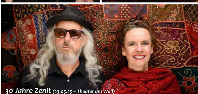
30 Jahre Zenit (23.05.25 – Theater am Wall)